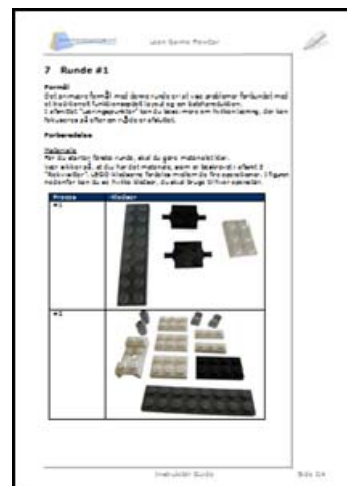
Eksempel fra instruktør guiden (fra den engelske version)

Besøg vores hjemmeside og lær på kort tid om effekten af Lean værktøjerne - og alt dette uden at overskride dit budget.