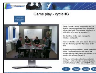
Videoklip fra hver runde viser dig hvordan spillet afvikles. (fra den engelske version)